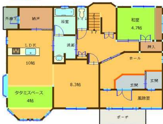
写真 平成25年築のオール電化！