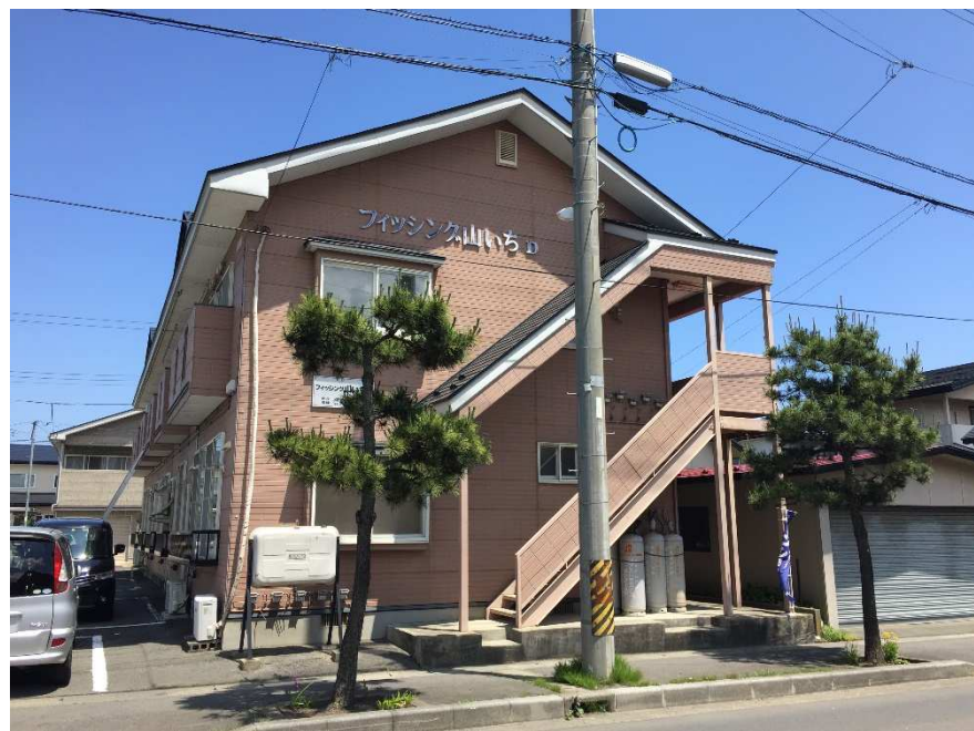
図面と現況に相違がある場合は現況が優先になります。