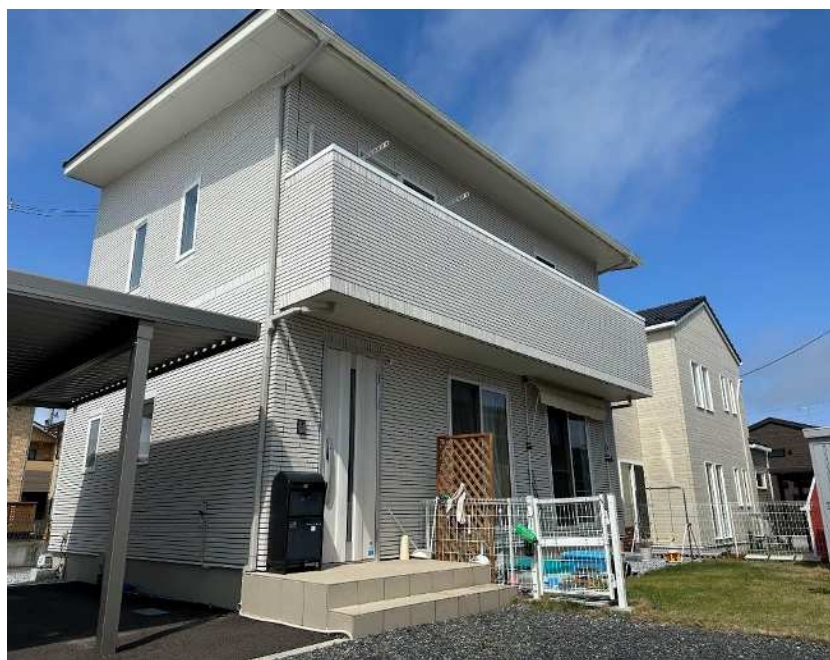
写真 令和2年新築 一条工務店施工