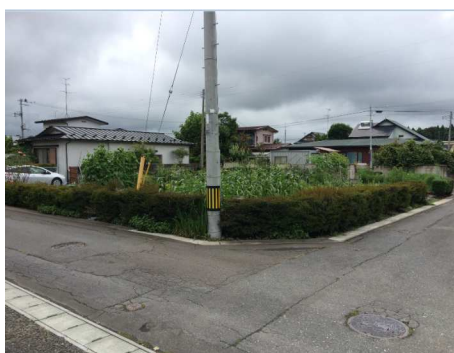
画面と現状が異なる場合は、現状を優先させていただきます。

所在地:十和田市ひがしの2丁目60-579内一部 地積:約470㎡ 約142坪 用途地域:第一種低層住居専用地域 都市計画:区域内 非線引地域 建ぺい率:50% ・ 容積率:80% 道路:公道4.6m・間口約22.3m・奥行約21.0 設備:水道引込20φ(メーター13)・下水引込有 取引態様 : 仲介 地目:宅地 学区:東小学校・東中学校